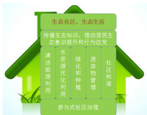
图 1. 万通生态社区模式

本报告根据对北京和天津四个生态社区的访谈和实地考察完成，反映了这些城市社区和利益相关者的情况。本报告的结论、研究和发现并不能代表中国所有生态社区的情况。