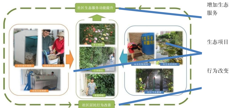
图 4: 万通基金会生态社区模式不同要素的细分

基金会或其他生态社区项目的实施者可以简化并细分生态社区中生态系统的每个要素并确定实施所需的硬技术和软技能，以及其他所需的投入。这有助于使合作伙伴根据自己的优势与相应的项目部分进行匹配，并确定在资源方面存在的差距。同时，这也有助于合作伙伴调整项目措施，使其适用于不同的社区类型。